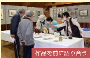
作品を前に語り合う