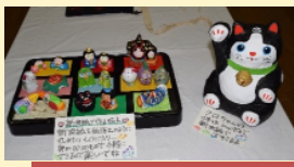
新聞紙で作った張子の置物

作品の展覧はあかしあクラブの会員でなくても、あかしあ台自治会員またはあかしあ台小学校児童であればOKだそうです。来年はご自身の作品出典についてトライしてみてもいいのではないでしょうか？