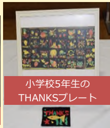
小学校5年生の THANKSプレート